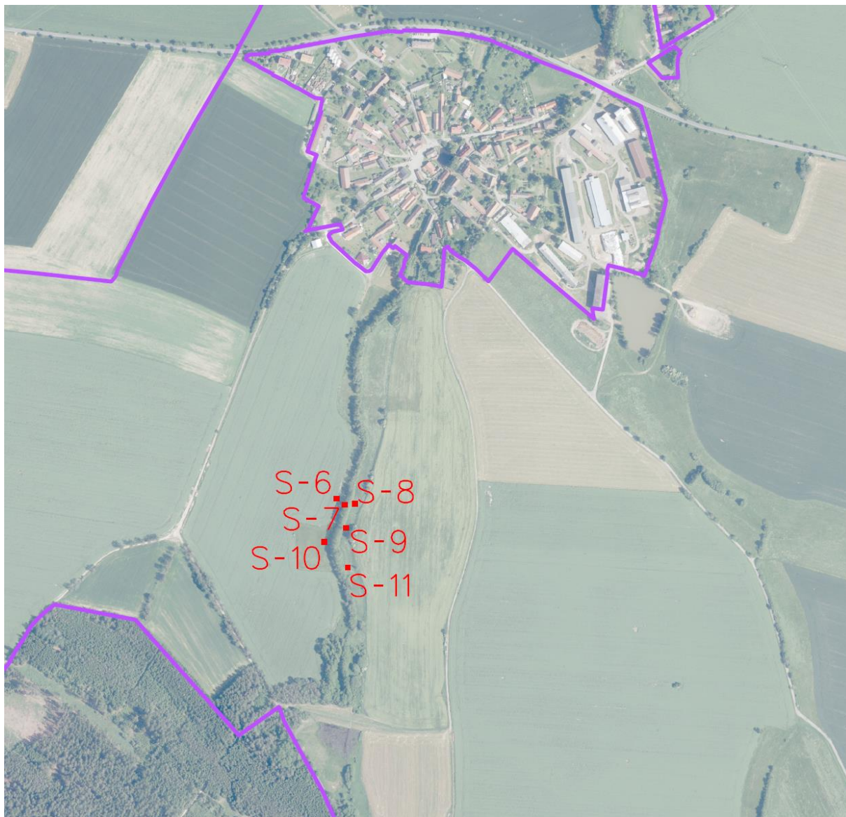
Lokalita Za humny - podrobný zákres sond S-6 až S-11 (malá vodní nádrž MVN3)