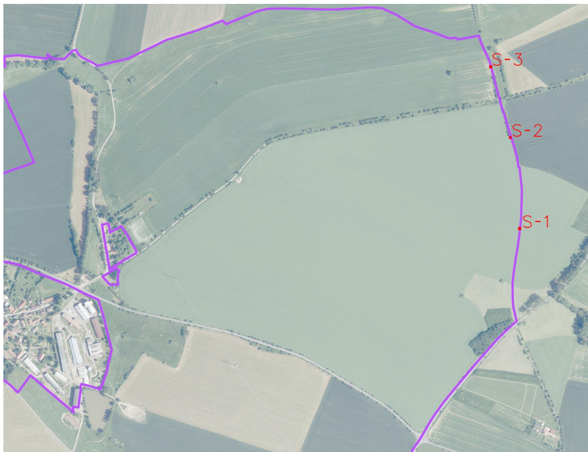
Lokalita V kohoutích - podrobný zákres sond S-1 a S-2 (polní cesta VC11) Lokalita V dubinách – podrobný zákres sondy S-3 (polní cesta VC16)